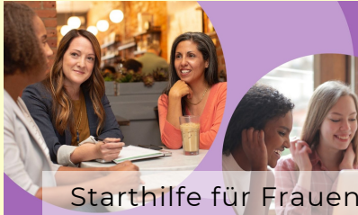
Starthilfe für Frauen Sprachcafé