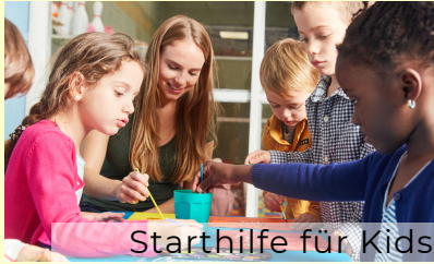
Starthilfe für Kids Schulkindbetreuung